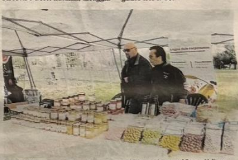
Agorà della cooperazione. Legacoop nel fine settimana al Parco Uditore

In contemporanea, sabato alle 17,30 alla Casa della Cooperazione (via Ponte di Mare 45 a Sant'Erasmo) si presenta Camminando nella foresta con Chico Mendes: la storia dell'Amazzonia, la lotta per la sopravvivenza e il riscatto delle popolazioni locali nelle parole di Gomerindo Rodrigues, braccio destro del leader sindacale dei seringueiros (i raccoglitori di gomma) e ambientalista brasiliano, ucciso in un agguato nel 1988.