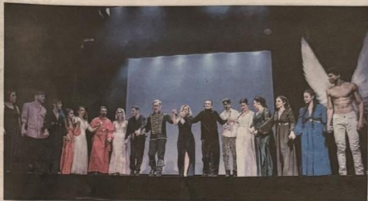
Opera e musical. Un momento della Tosca rivisitata con le musiche del cantautore bolognese